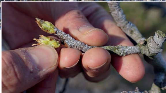
René Bal bekijkt de bloemknoppen op het proefperceel.

„Vooralsnog zie ik weinig dode knoppen; de start van het seizoen lijkt dus goed.”